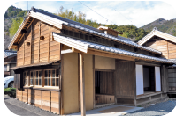
花沢地区 ビジターセンター