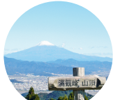
山頂からの 富士山絶景